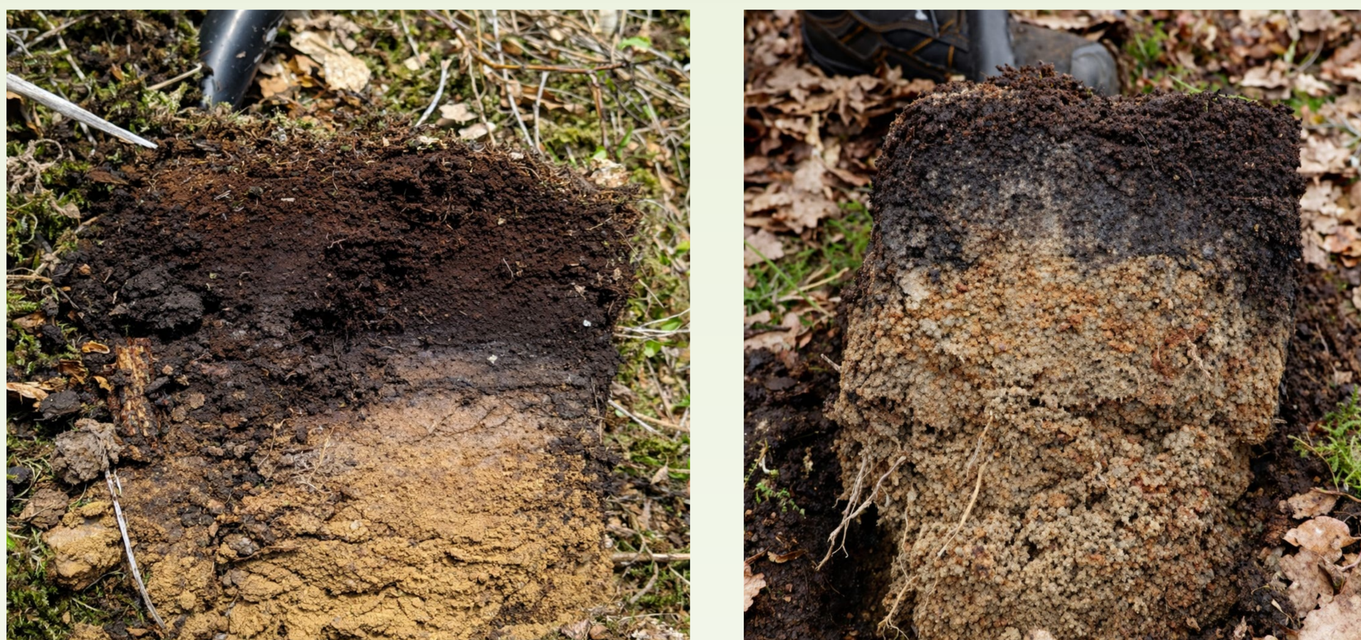
Abb. 3 und 4: Spatenproben stark versauerter Oberböden mit erkennbarer Säurebleichung