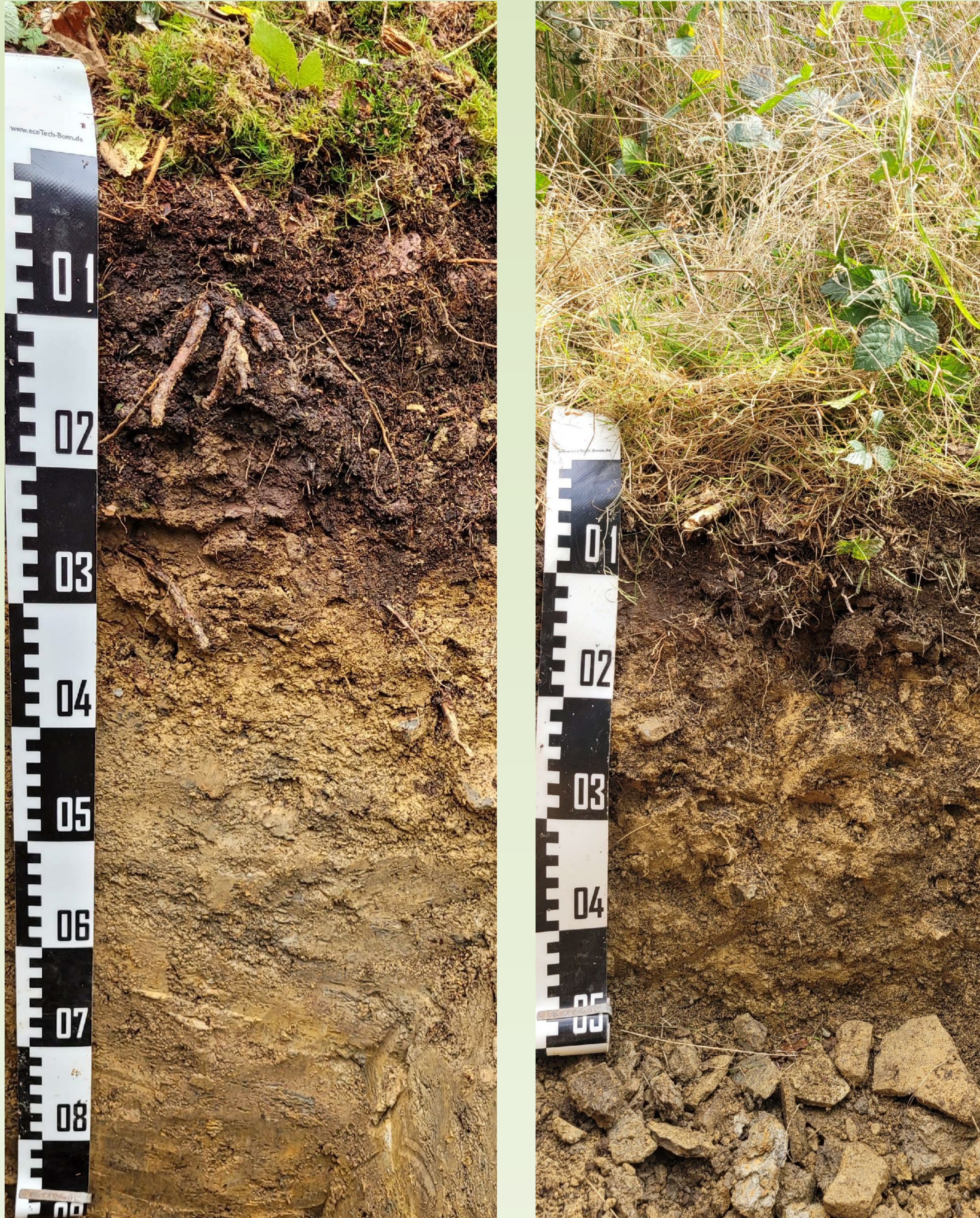
Abb. 1 und 2: Bodenprofilaufnahmen eines Braunerde-Pseudogleys (links) und einer Braunerde (rechts) im Arnsberger Wald mit Rohhumusauflage

Vorstellung des Arbeitspakets 7 (Waldboden) im Projekt „ReForm-regioWald“